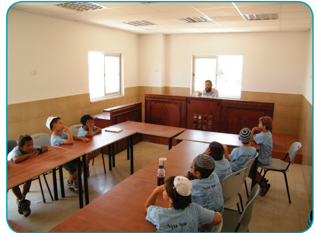
סיור לימודי בבית הדין בשדרות

את כל שאר המסמכים הקשורים לתביעה יש להביא לדיון הראשון. רצוי שכל צד יכין לעצמו בצורה מסודרת את הסיבות לתביעה, אם שני בעלי הדין הגיעו להסכמה להגשת טענות בכתב, הדבר אפשרי.